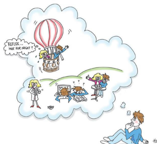
Figur 2: Refleksion

Ligeledes ses udvikling af personlige og faglige kompetencer som studieforberedende til videre uddannelse.