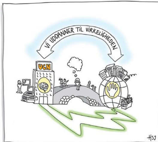
Figur 1: Refleksiv Praksislæring