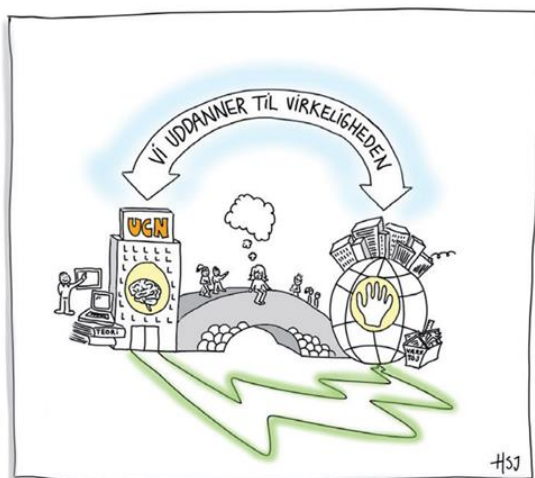
Figur 1: Refleksiv Praksislæring