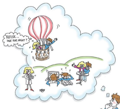
Figur 2: Refleksion

Ligeledes ses udvikling af personlige og faglige kompetencer som studieforberedende til videre uddannelse.