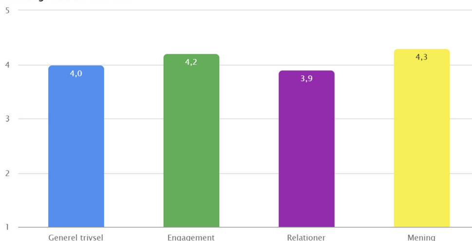
1. måling - EHAN-CHV-S23